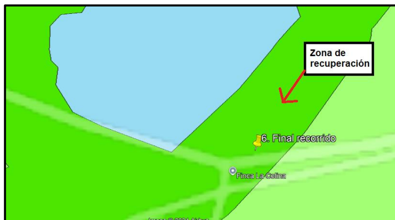
Ilustración 2. Punto donde se evidenciaron afecciones en la zona de recuperación del humedal Gualí – Vereda El Cacique.

Dentro del recorrido en el humedal Gualí en la vereda El Cacique, en el punto 6 con coordenadas 4^{\circ}45'7.176''\text{N} - 74^{\circ}13'4.95''\text{O} , perteneciente a la zona de recuperación (ver ilustración 2), se evidenció la presencia de residuos plásticos y de vidrio (botellas). Por tanto, se procedió a realizar el debido reporte a la EMAAF para su colección y disposición final. (Ver ilustración 3)