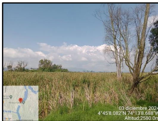
Ilustración 5. Evidencia recorrido, punto 2.