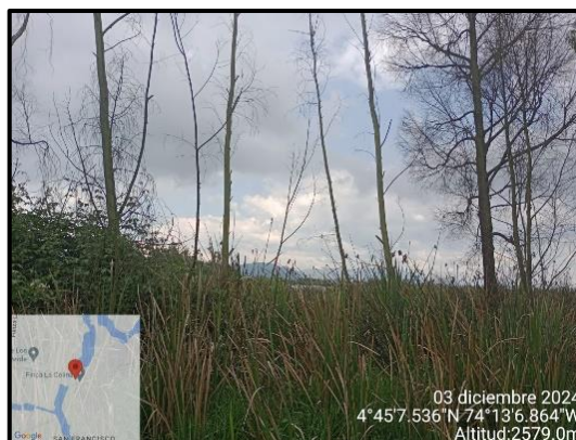
Ilustración 7. Evidencia recorrido, punto 4.