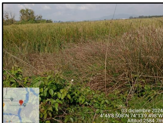
Ilustración 4. Evidencia recorrido, punto 1.

Dentro del recorrido en el humedal Gualí en la vereda El Cacique, en los puntos 1, 2, 3, 4 y 5 no se evidenció presencia de motobombas, ganado, ni posibles rellenos como se evidencia a continuación: