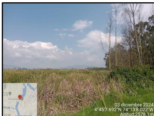
Ilustración 6. Evidencia recorrido, punto 3.