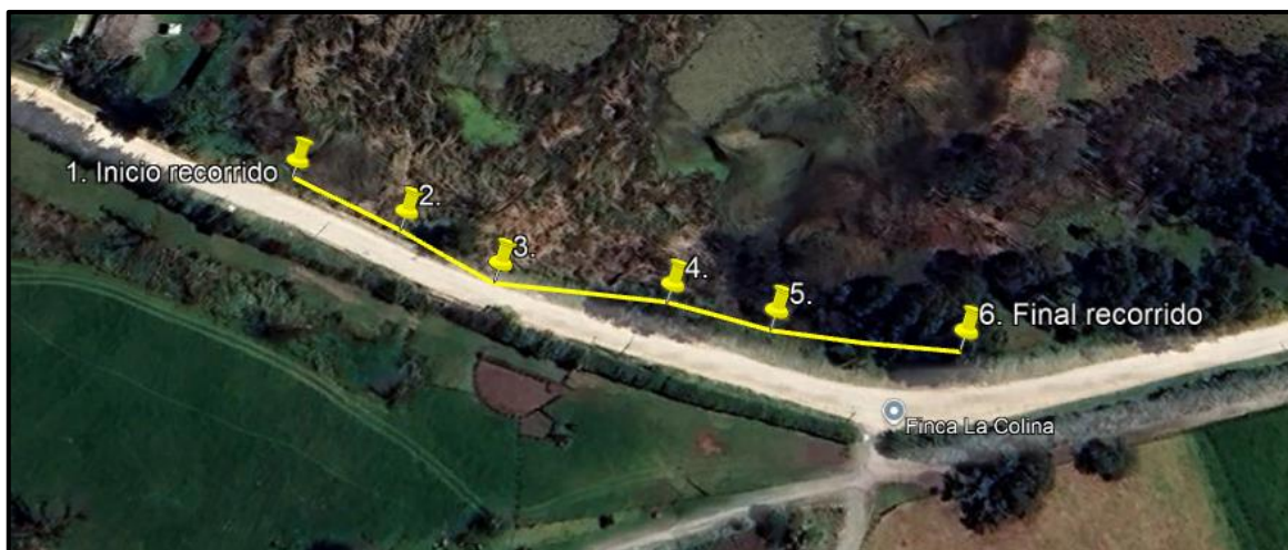
Ilustración 1. Recorrido de control y vigilancia humedal Gualí – Vereda El Cacique.

Con base en lo anterior, el día 03 de diciembre de 2024 se realizó recorrido de control y vigilancia en el humedal Gualí desde las coordenadas 4°45'8.508"N – 74°13'9.498"O hasta las coordenadas 4°45'7.332"N – 74°13'6.18"O (ver ilustración 1. Ruta amarilla) vereda El Cacique, ecosistema que fue declarado por la Corporación Autónoma Regional de Cundinamarca - CAR como Distrito Regional de Manejo Integrado a través del acuerdo 001 de 2014 "Por medio del cual se declaran como Distrito Regional de Manejo Integrado (DMI), los terrenos comprendidos por los humedales de Gualí, Tres Esquinas y Lagunas de Funzhé, y su área de influencia directa ubicada en los municipios de Funza, Mosquera y Tenjo, Cundinamarca", y estableció tres zonas: 1. Preservación (espejo de agua), 2. Recuperación (50 metros) y 3. Uso sostenible (100 metros).